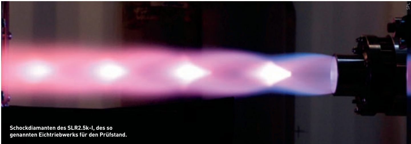
Schockdiamanten des SLR2.5k-I, des so genannten Eichtriebwerks für den Prüfstand.